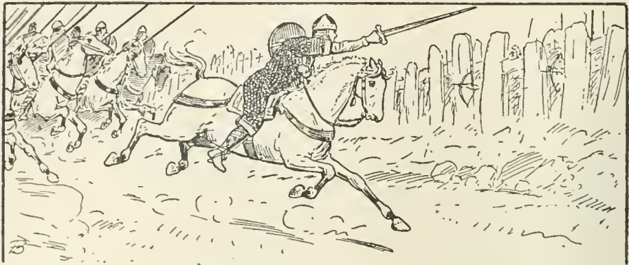
Taillefer poussa son cheval... (page 101)